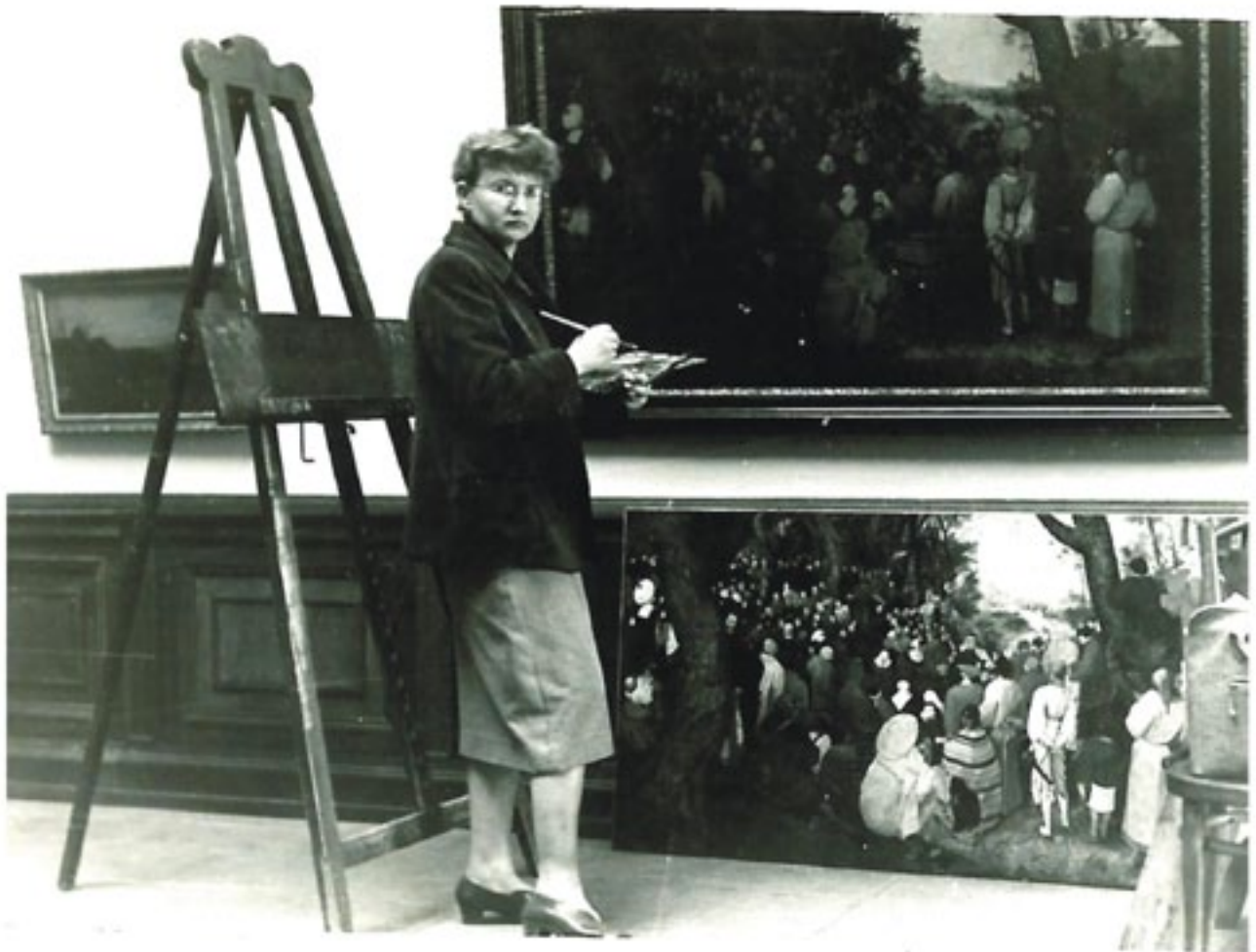
Id. Pieter Bruegel Keresztelő szent János prédikációja című képe másolásának utolsó fázisa, az eredeti és a másolat összehasonlítása