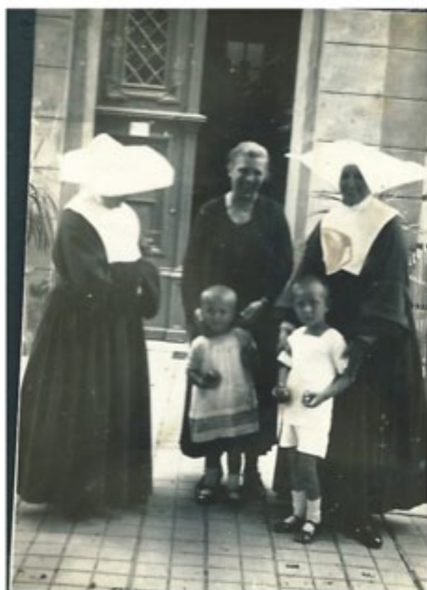
Ranolder Intézet kapujában