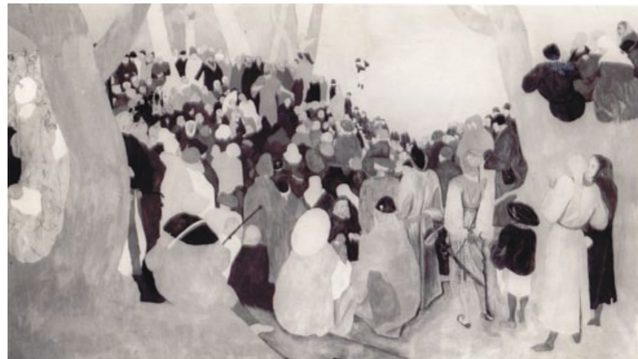
Id. Pieter Bruegel Keresztelő szent János prédikációja című képe másolatának tempera aláfestési fázisa