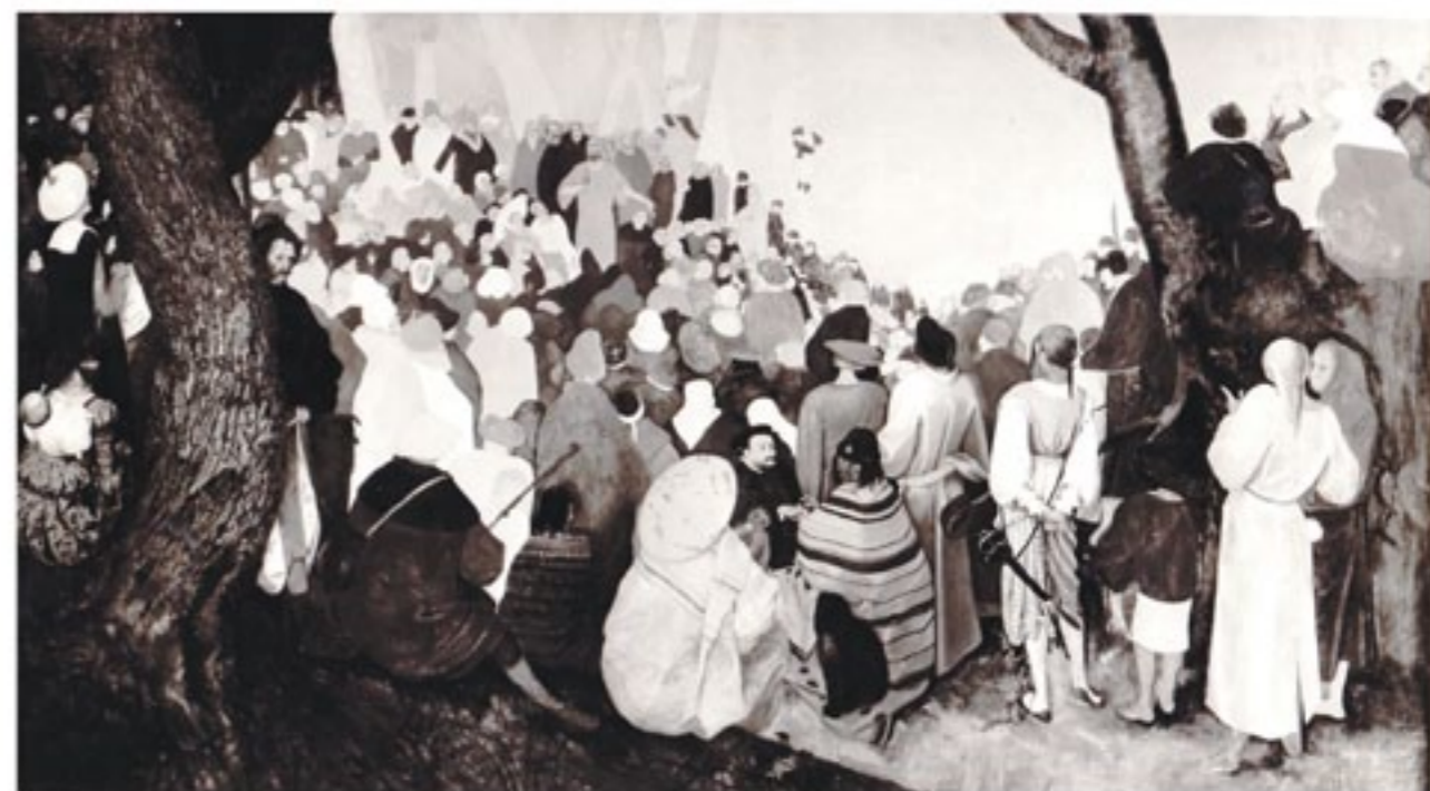
Id. Pieter Bruegel Keresztelő szent János prédikációja című képe másolatának olaj festés megkezdése kori fázisa