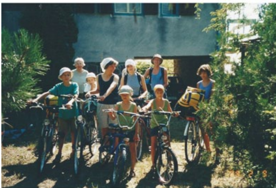
Unokák egy csoportjával